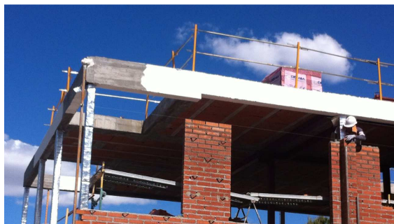
ISOTERMAS APLICANDO PAINTER: