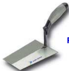
PALETA NORTE REF. 695 004 8