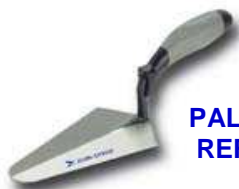
PALETA MADRILEÑA REF. 695 004 9