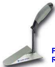
PALETA CATALANA REF. 695 004 7