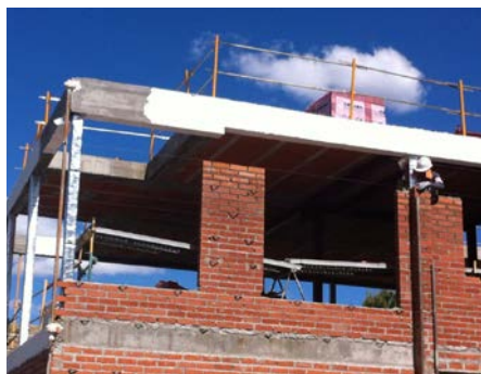
ISOTERMAS APLICANDO PAINTER