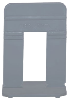
AS FAST PIEDRA