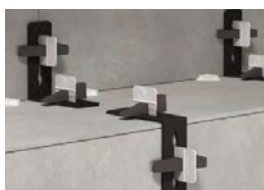
ESCUADRA NIVELACIÓN 25 uds. REF.: 714 191

Con la pinza ejercemos la presión necesaria en todas las cuñas de manera rápida, consiguiendo dejar todas las piezas niveladas. Regulable (con indicador de espesor de la pieza). rodusta y duradera.