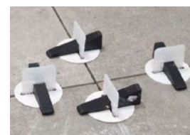
PROTECTOR DE BALDOSA 100uds. REF.: 714 19