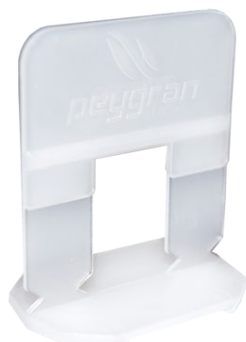
AS FAST CERÁMICA con rebajes para rotura